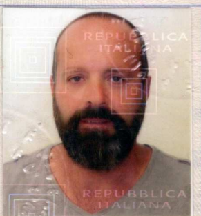
Fotografia del titolare del certificato Photograph of the holder of the certificate

Firma del titolare del certificato / Signature of the holder of the certificate